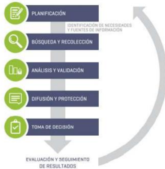
Figura 1: Proceso de VT